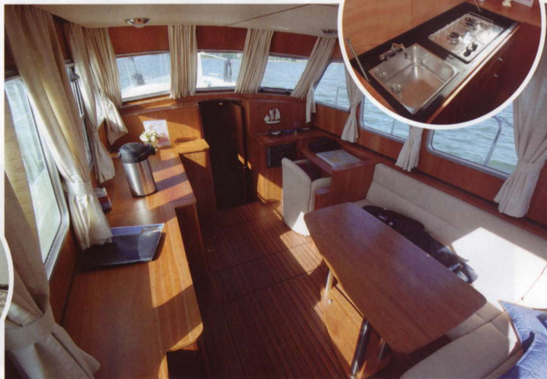
Olohuone keittonurkkauksella. Salonki on avara ja valoisa joskaan ei erityisen tunnelmallinen. Paapuurin pitkän kaapiston keulapäähän kätkeytyy pentteri ja peräpäähän baarikaappi.