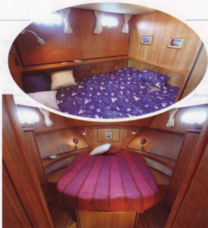
Makuukajuutat ovat toteutukseltaan onnistuneita ja vuoteet reilusti mitoitettuja. Säilytystiloja on runsaasti niin kaapeissa kuin vuoteiden alla. Kuvissa näkyvät kolme lukulamppua ovat poiminta lisävarustelistalta hintaan 660 euroa.

rantaautumisvalmisteluihin ja keulakajuutan sekä salongin katoilla leppoisan kelin loikoiluun. Keula itsessään on massiivisen korkealla, joten Linsseniin keulasta kulkeminen on useimmilta meillä tavatuilta venelaitureilta haasteellista. Avuksi löytyy lisävarustelistalta irrotettavat keulaportaat.