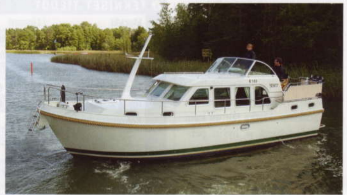
Linssenin käsiteltävyys on hyvällä tasolla, veneen kääntää ympäri yllättävänkin pienessä tilassa. Siltikin keulapotkurin soisi kuuluvan vakiovarusteisiin.

Noin kuuden solmun matkanopeudella Linssenin voi odottaa taittavan matkaa noin meripeninkulman litralla polttoainetta. Kustannuksiltaan siis veneen koko huomioiden hyvinkin kohtuullista. Huippunopeudella kii-rehtimisessä ei Linsseninkään tapauksessa ole mitään järkeä, sillä se karkeasti arvioiden tuplaa