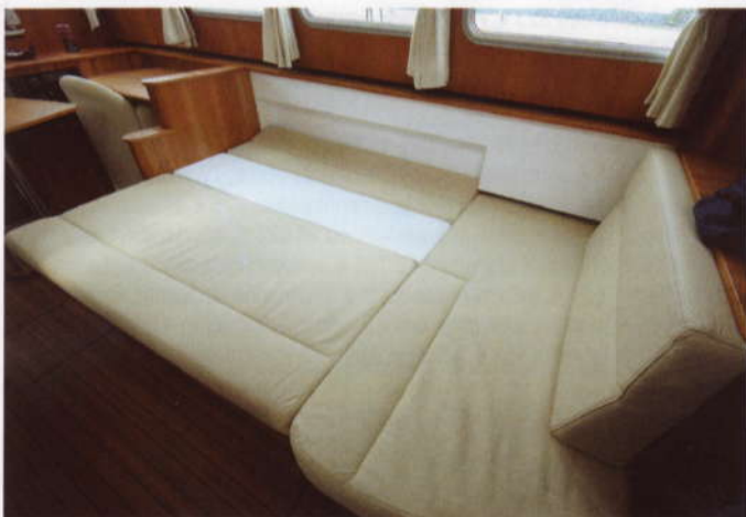
Sohva muuntuu varsin näppärästi tilavaksi parivuoteeksi.

Ennakoarvioihin nähden Linssenin voi todeta yllättäneen todella positiivisesti. Veneen liikehdintä aallokossa on selkeää, mutta rauhallista. Vasta-aallokoon etenemisessä on kaksi toisistaan hyvin erotettavissa olevaa ominaisuutta.