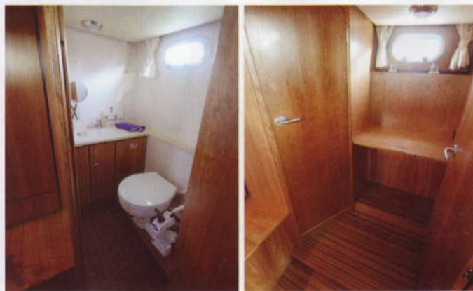
Perätoiletti on keulan vastaavaa kompaktimpi mutta täysin käyttökelpoisen kokoinen. Toiletin oven ja takakajuutan oven ja laipion väliin puristuksiin jäävä tila jäänee nykyisellään hyödyntämättä. Ulkoa operoitavassa matkaveineessä tilalla voisi olla vaikka kunnan kuivauskaappi ulkovaatteille.