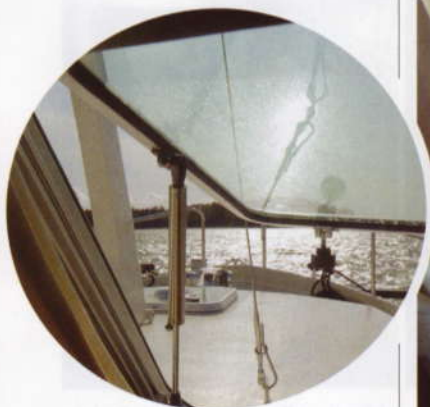
Yksi salongin etuikkunaruuduista on avattavissa.

Säilytystiloja löytyy takakajuutastakin hyvin, sillä peräseinustalla on vaatekaappi jota täydentävät vuoteen alle ja laipioon upotetut kaapistot. Runkoikkunoita on täälläkin neljä, mutta monesta takakajuutallisesta veneestä tutut takanäkymät Linssenistä puuttu-