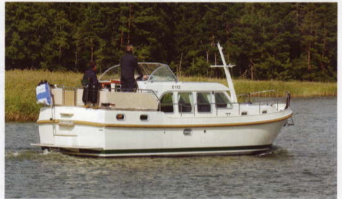
Linssen on profiililtaan melko matala huolimatta siitä, että tuulilasien yläreuna on 2,5 metrin korkeudella vedenpinnasta. Hieno maalipinta kätkee alleen pohjassa ja kyljissä viiden ja kansirakenteissa neljän millimetrin paksuisen teräsrungon.

polttoaineenkulutuksen matkanopeuksiin nähden.