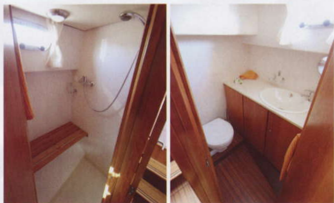
Keulan saniteettitiloissa riittää hyvin tilaa. Suihkuhuoneessa on seisomakorkeutta 180 sentin verran, mutta kukas nyt seisoskelemaan kun penkki on tarjolla.

Hollantilaisten teräsveneiden mainetta laadukkaina ja tilavina veneinä ei ole kiistäminen, mutta enemmän keskustelua sen sijaan